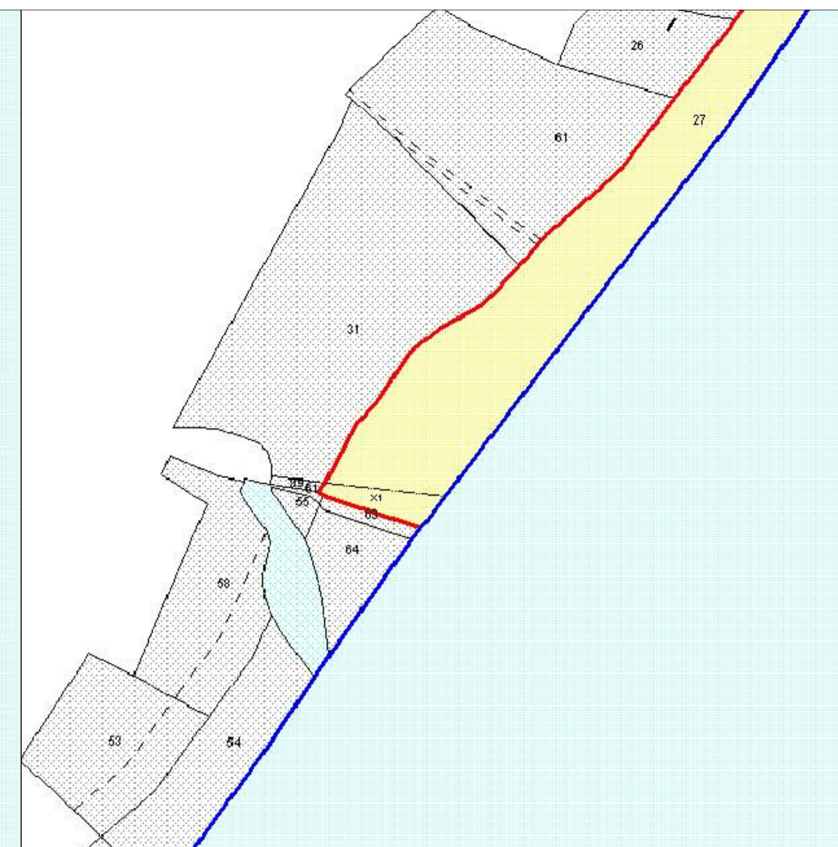
① DAL CONFINE CON SQUILLACE, CAMPING CALABRISELLA